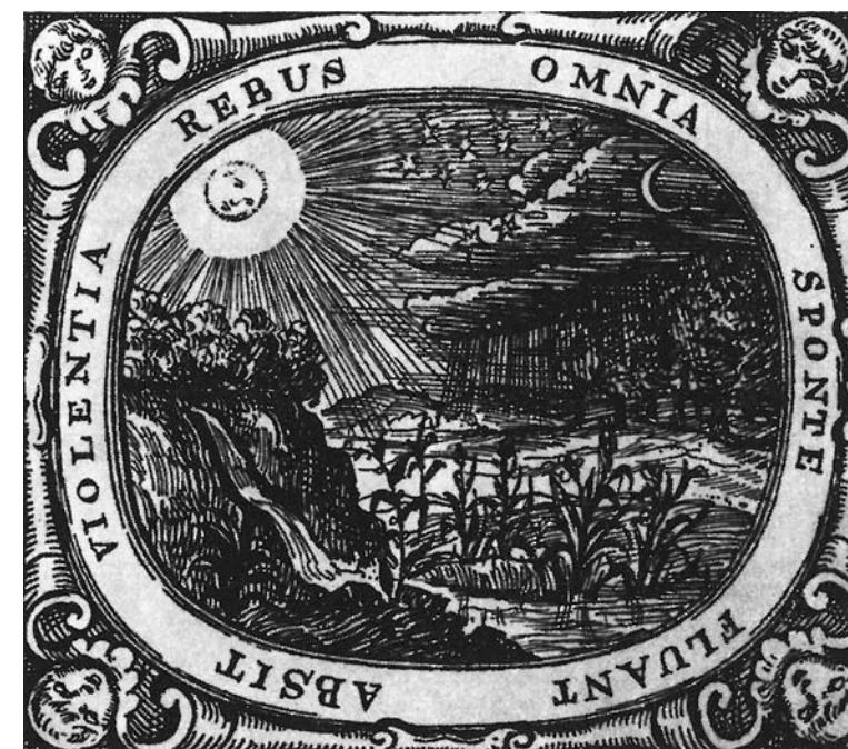
„Omnia sponte fluant absit violentia rebus“ – Všechno ať samo plyne, ať ve věcech násilnost není. Citát vepsaný v obrázku z Komenského didaktických spisů. (Obr. commons.wikimedia.org.)

Soustavné a úplné vzdělání lze sice získat pouze ve škole, ovšem školský systém musí být racionální a účelně uspořádaný. Školy se musí stát z „robotáren a dušeních rasoven“ „pravými dílnami moudrosti a lidskosti“, kam by žáci i učitelé rádi chodili. Jako ideální model navrhoval Komenský čtyřdílný výchovný cyklus, jehož jednotlivé etapy by trvaly vždy šest let. Děti do šestého roku věku mají být vychovávány ve „škole mateřské“, což ovšem znamená v „matčině klíně“, doma v rodině. Teprve pak nastupují do školy obecné neboli městské s výukou v ma-